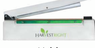
Maisiņu aizīmogošanas ierīce